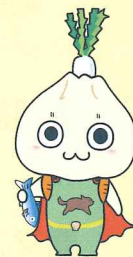
神奈川県食育マスコット かなふう